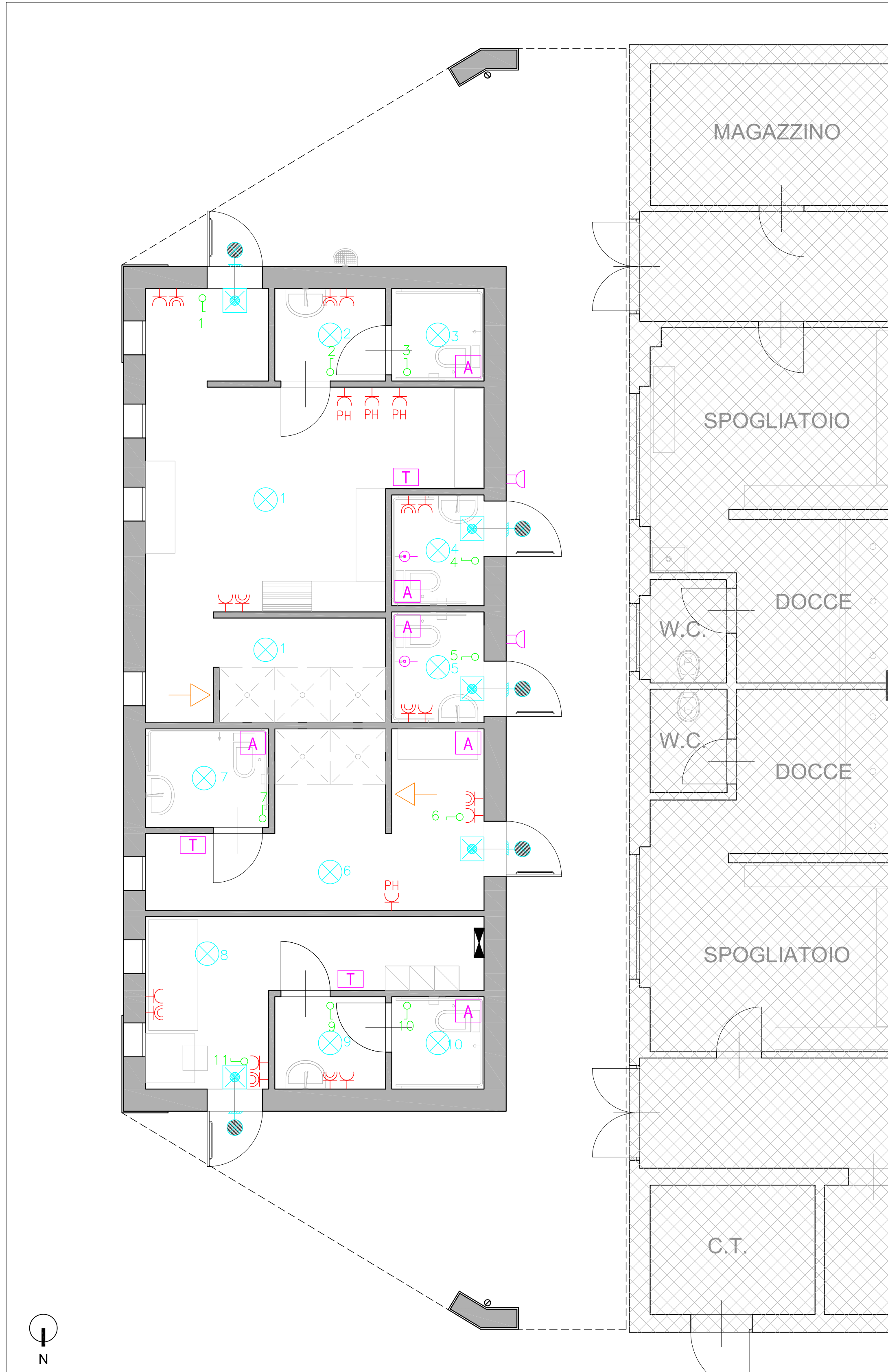
IMPIANTO ELETTRICO - LAYOUT (scala 1:50)

L'APPALTATORE, PRIMA DELL'INIZIO ESECUZIONE LAVORI, DEVE VERIFICARE LE CONDIZIONI DELLA CALDAIA ESISTENTE E VALUTARE LE OPERE DI MODIFICA NECESSARIE PER LA FUNZIONALITÀ DEI NUOVI IMPIANTI.