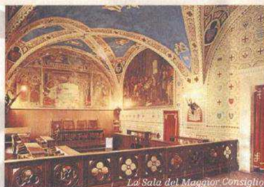
La Sala del Maggior Consiglio

La sala può ospitare circa 90 persone a sedere oltre agli sposi e ai testimoni. I testimoni devono essere in numero di due. Il costo della cerimonia è di 100 € per i residenti in Volterra e di 500 € per i cittadini non residenti. La sala è disponibile per 1 ora durante la quale, oltre alla celebrazione del matrimonio, gli sposi possono farsi le fotografie ed intrattenere gli invitati. Per un brindisi è possibile utilizzare la sala attigua ( Sala della Giunta ) con un costo aggiuntivo di 100 €.